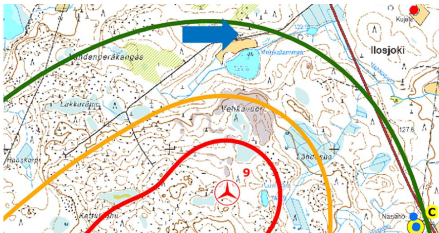
Kuva 2: Vehkalammen kohteen sijainti osoitettu sinisellä nuolella

Vehkalammen kohteella on rakennuslupa mutta sitä ei ole rakennusrekisterissä. Kohteen rakennuttaja oli kuollut rakennuksen valmistumisen aikaan.